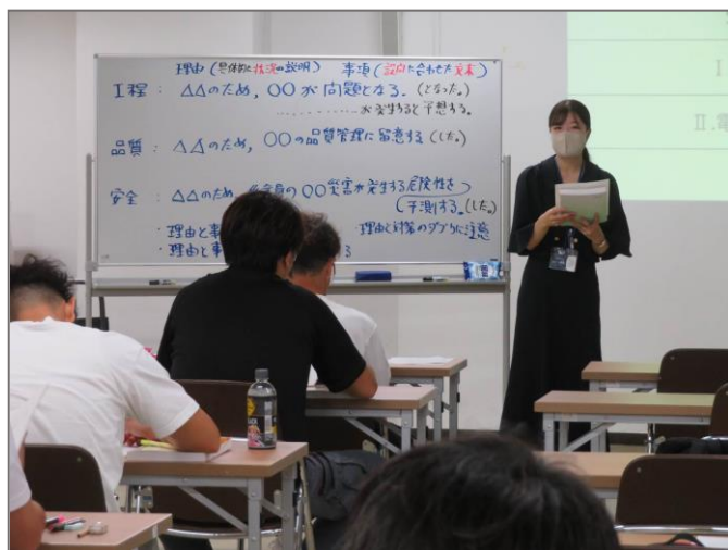
講習会と試験対策のガイダンスから始まりました。