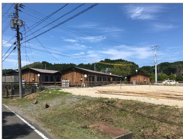
下矢田応急仮設住宅の視察

そして、それに対応してきた皆様のお話を伺い、被災時の急場をしのぎ、ここまでの復興を支えてきたのは、防災協定うんぬんといったシステム的なものではなく、現地の方々の、人助けの心、地元へ貢献しようという心、そして、電気屋としての矜持といったものであったのだと強く感銘を受けました。