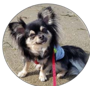
今年の干支です。Black&White なんだワン!!

私は、近年、歳を重ねて若くはなくなってきたなあと、自分で感じることしきりですが、「自分を信じて折れない心」や、「悔しさをばねに頑張る心」を持ちながら、日々頑張りたいと思います。