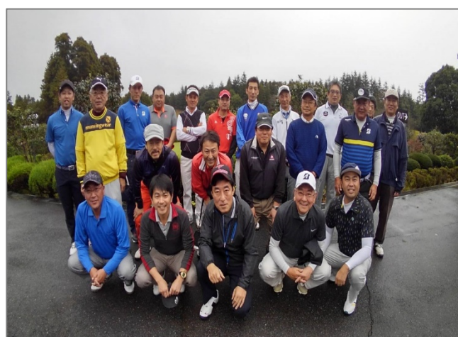
天気が悪い中、集まった愉快的メンバーです。