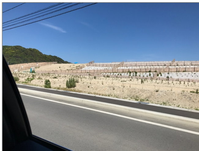
豊間地区などの堤防のかさ上げ

ただ、どこまで事前に備えておいたとしても、被災時には、やはり、自分たちや周辺のことを優先せざるを得なく、公的な面では、臨機応変な対応にならざるを得ないこともあるのだと知りました。