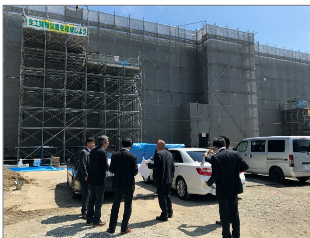
復興公営住宅・下矢田団地の視察

まとめませんが、自社の力を高めることと、公のことの両方を考えていきたいと思えました。