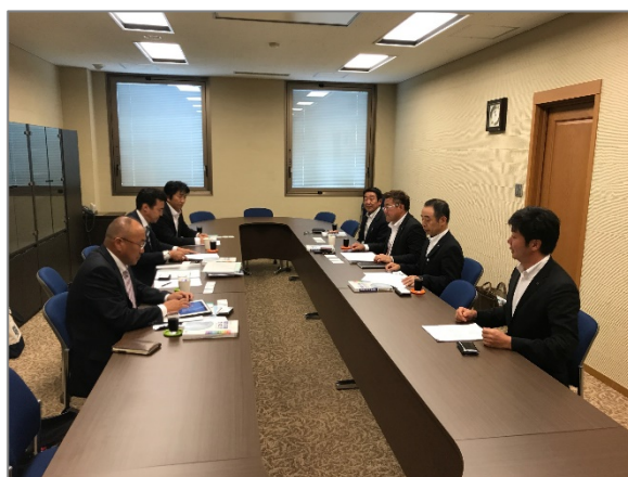
岡田電気産業様との意見交換会

具体的な情報は、防災研修会でもお伝えした部分もありますので、この稿では割愛しますが、当時の状況の説明を受け、改めてその壮絶さに、その場にいたらと思うと、困惑や絶望に近い感情を抱きました。