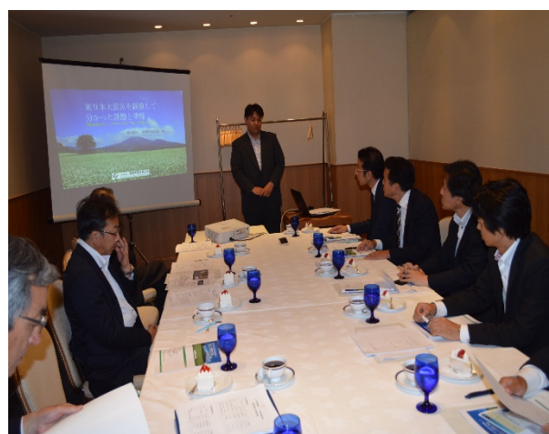
(一社)福島県電設業協会との意見交換会