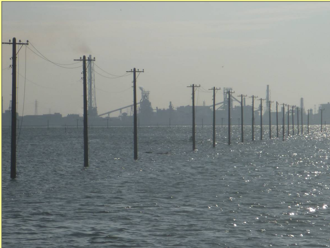
江川海岸（木更津市）

当協会のホームページでは、事業や研修会などが紹介されています。 また、会員名簿や入札情報など、業務に役立つ情報も随時更新していますので、ぜひご利用ください。 ご意見やパスワードなどの問い合わせは、事務局をお願いします。