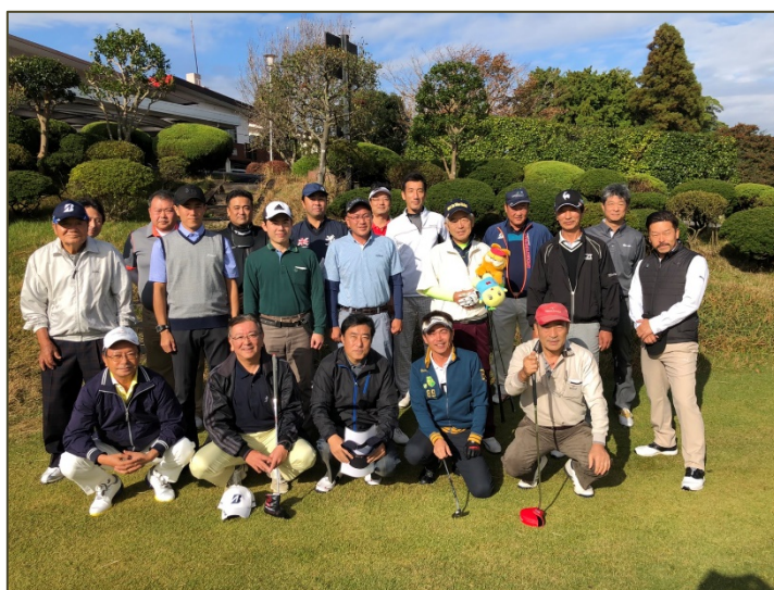
当日ご一緒したゴルフの大先輩の方々

昨年コースデビューした時は 166 打も叩いてしまい、一緒にプレーした方々には多大なるご迷惑を掛けてしまいました。そこから何とか順調にスコアを伸ばしてきましたが、まだミスが目立ち、煩惱の数にたどり着くまでの道りは険しいです。