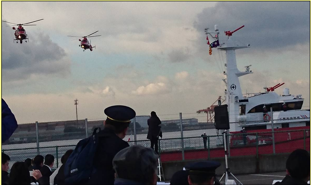
千葉港・消防ヘリ出初式（千葉市）

当協会のホームページでは、事業や研修会などが紹介されています。 また、会員名簿や入札情報など、業務に役立つ情報も随時更新していますので、ぜひご利用ください。 ご意見やパスワードなどの問い合わせは、事務局にお願いします。