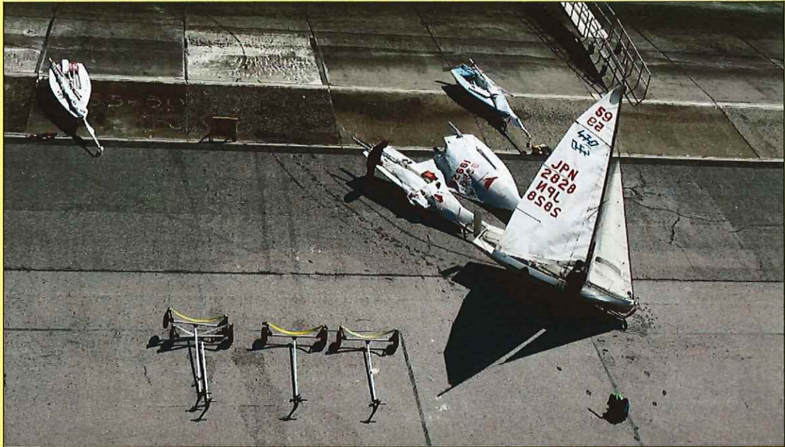
稲毛海岸ヨットハーバー（千葉市）

当協会のホームページでは、事業や研修会などが紹介されています。 また、会員名簿や入札情報など、業務に役立つ情報も随時更新していますので、ぜひご活用ください。 ご意見やパスワードなどの問い合わせは、事務局にお願いします。