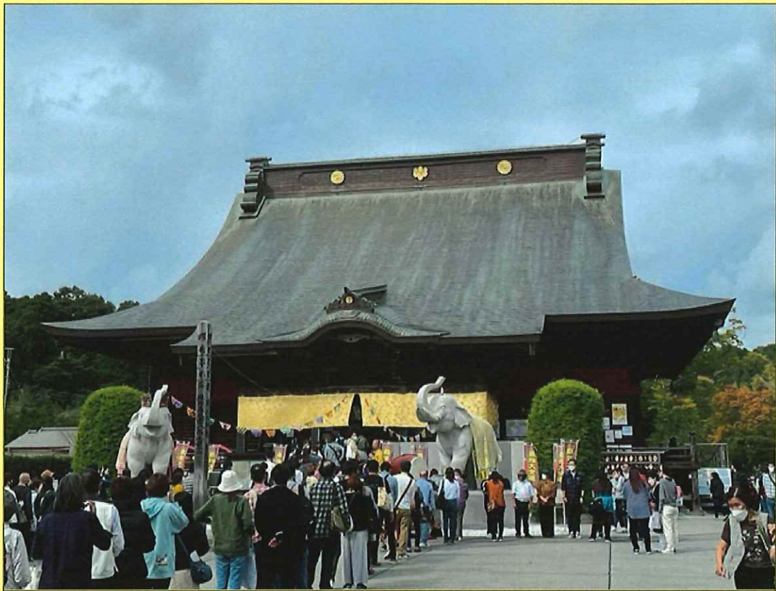
長福寿寺（長生郡長南町）

当協会のホームページでは、事業や研修会などが紹介されています。 また、会員名簿や入札情報など、業務に役立つ情報も随時更新していますので、ぜひご活用ください。 ご意見やパスワードなどの問い合わせは、事務局をお願いします。