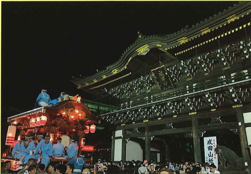
成田山祇園祭り（成田市）

当協会のホームページでは、事業や研修会などが紹介されています。 また、会員名簿や入札情報など、業務に役立つ情報も随時更新していますので、ぜひご活用ください。 ご意見やパスワードなどの問い合わせは、事務局をお願いします。