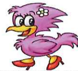
妹のカナタちゃんだよ！